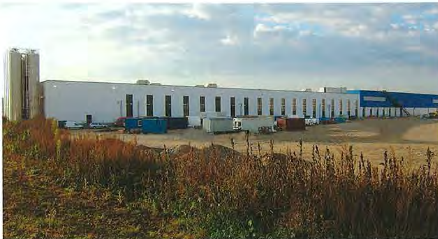
Erst kürzlich hat die dechant hoch- und ingenieurbau gmbh + co. kg das neue Glockenbrot Backwerk Süd der REWE-Gruppe fertiggestellt. (Quelle: dechant)

nutzt. „Über die GAEB-Schnittstelle lesen wir die Daten der ausschreibenden Stellen ein“, erklärt Dipl.-Ing. Jörg Handke, Kalkulator bei dechant. „Diese Daten werden dann in die Kalkulation gegeben und bearbeitet. Dort pflegen wir auch die Nachunternehmerangebote ein.“