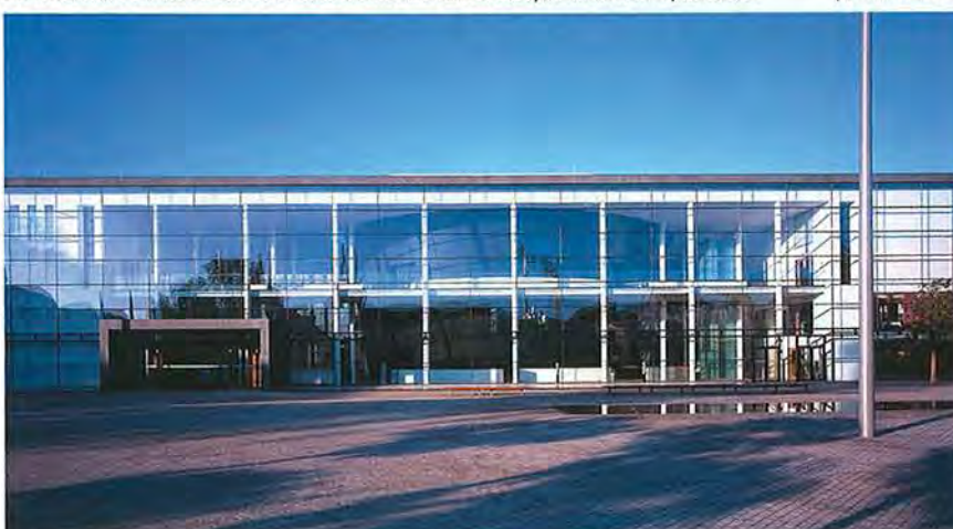
Der Neubau des Theaters Erfurt wurde 2003 eröffnet und zählt zu Europas modernsten Spielstätten.

Möge die gemeinsame Erfolgsgeschichte von dechant und Nemetschek noch lange anhalten. ■