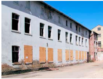
Bestehende Fassade bei Baubeginn