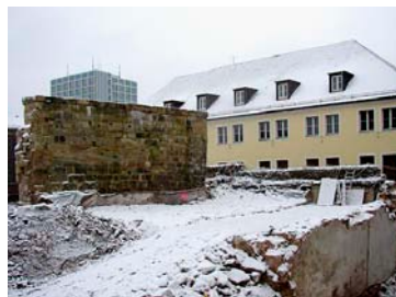
Stadtmauer vor Sicherungsmaßnahme