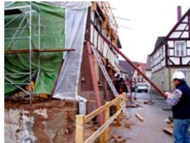
Aussteifungskonstrukt für Bauzustand