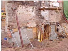
Unterfangungsarbeiten der zu erhaltenden Stadtmauer