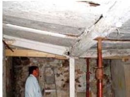
Anheben der alten Holzdecken um 40 cm