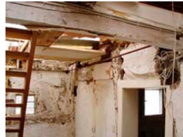
Zustand der Decke im I. OG vor Sanierung des Altbaus