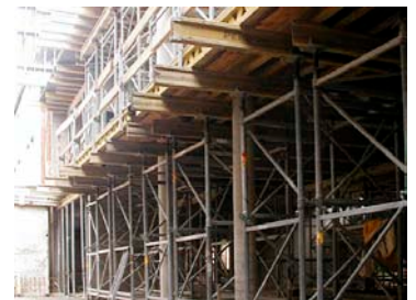
Rüstung der Galerie