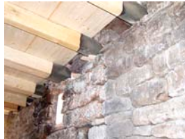
Sandsteinwand und neue Holzdecke Altbau