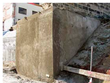
Stadtmauer nach Sicherung