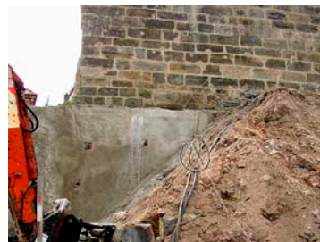
Spritzbetonwand bei Stadtmauer