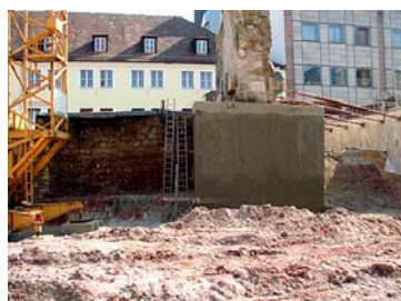
Temporäre Abstützung der Stadtmauer als Kippsicherung