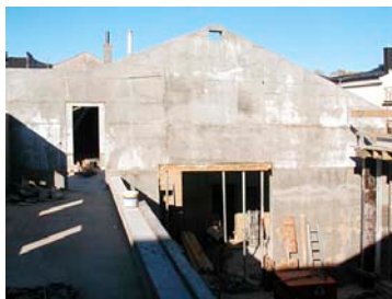
Neue Zwischenwände in Sichtbeton