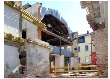
Absteifung der zu erhaltenden Gebäudeteile