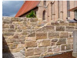
Sandsteinwand im Aussenbereich