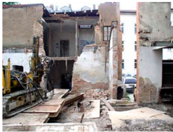
Herstellung der Stabverpresspfähle für die Fundamenterrichtung