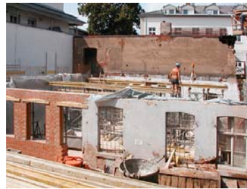
Beton- und Stahlbetonarbeiten im Bestand