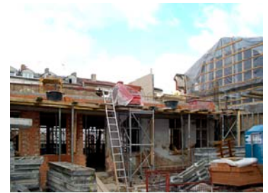
Beton- und Stahlbetonarbeiten im Bestand