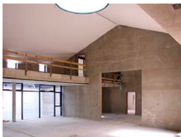
Fertiggestellte Rohbauarbeiten (innen)