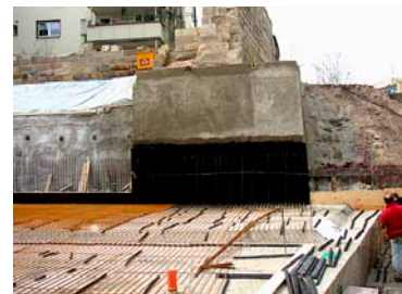
Sicherung der Stadtmauer mit Bohrpfahl- und Spritzbetonwand