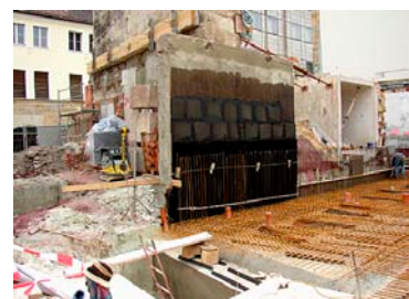
Spritzbetonsicherung der Unterfangung